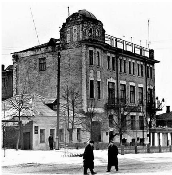
Доходный дом Иванова