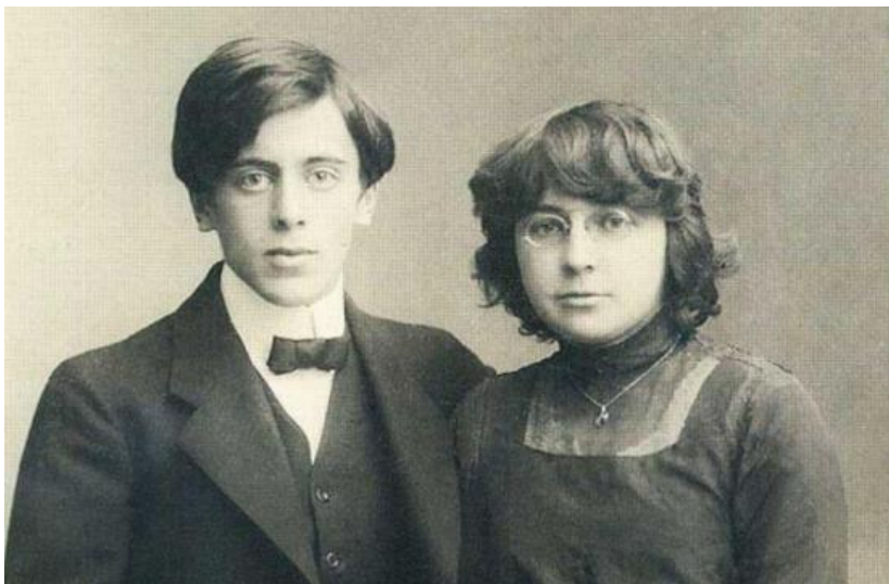
С.Я Эфрон и М.И. Цветаева

С будущей супругой Мариной Цветаевой Эфрон познакомился в Коктебеле, находясь на отдыхе. Ему было 17, избраннице — 18. В своих воспоминаниях Марина писала, что, увидев болезненного юношу, убитого трагической смертью брата и матери, сразу поняла: это ее судьба.