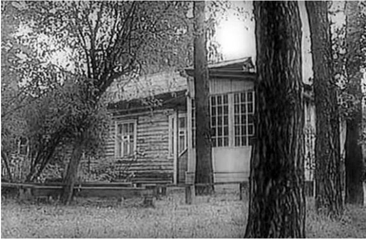
Дача НКВД в Болшево

По возвращении в Советский Союз Эфрону и его семье была предоставлена государственная дача НКВД в подмосковном Болшево. Здесь он прожил два года, очень много болел. Когда приехала Марина и Георгий, самочувствие его начало улучшаться, но спустя два месяца после возвращения жены в августе арестовали дочь Ариадну, а в октябре его самого.