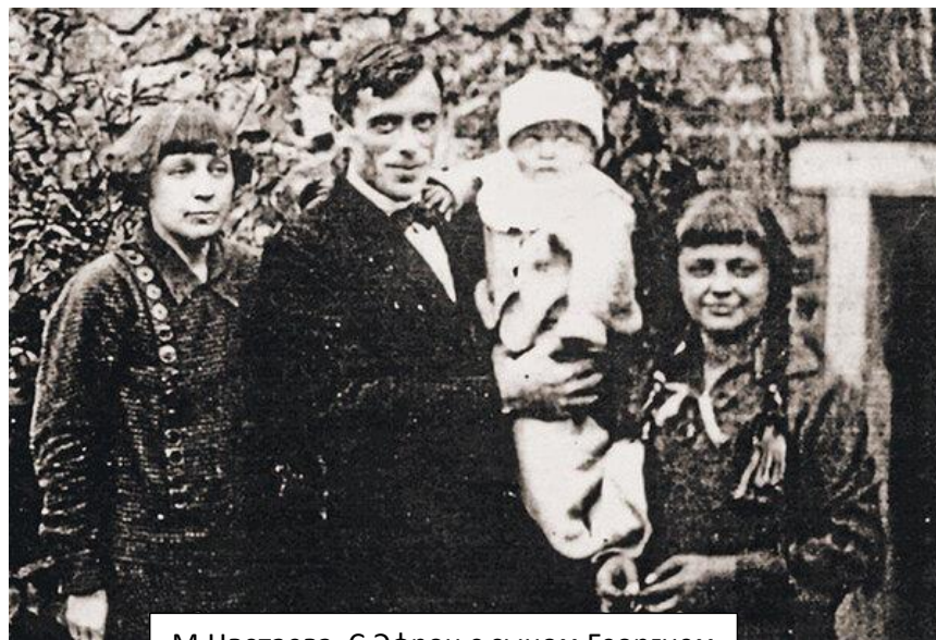
М.Цветаева, С.Эфрон с сыном Георгием и дочкой Ариадной