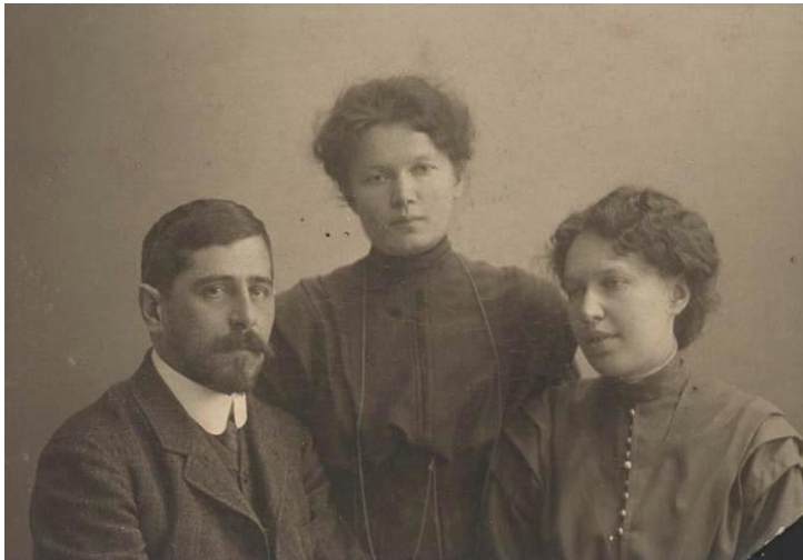
Д.Е. Жуковский, А.К. и Е.К. Герцык

В 1907 году появилась первая значительная публикация стихотворений Герцык – цикл «Золотой ключ» в альманахе символистов «Цветник Ор. Кошница первая». В кругу поэтов-символистов поэтессу называли полушутя-полусерьезно: «сивиллой, пророчицей, вещуньей» – так много было в стихах мистически-сказочных мотивов, предсказаний, предчувствий.