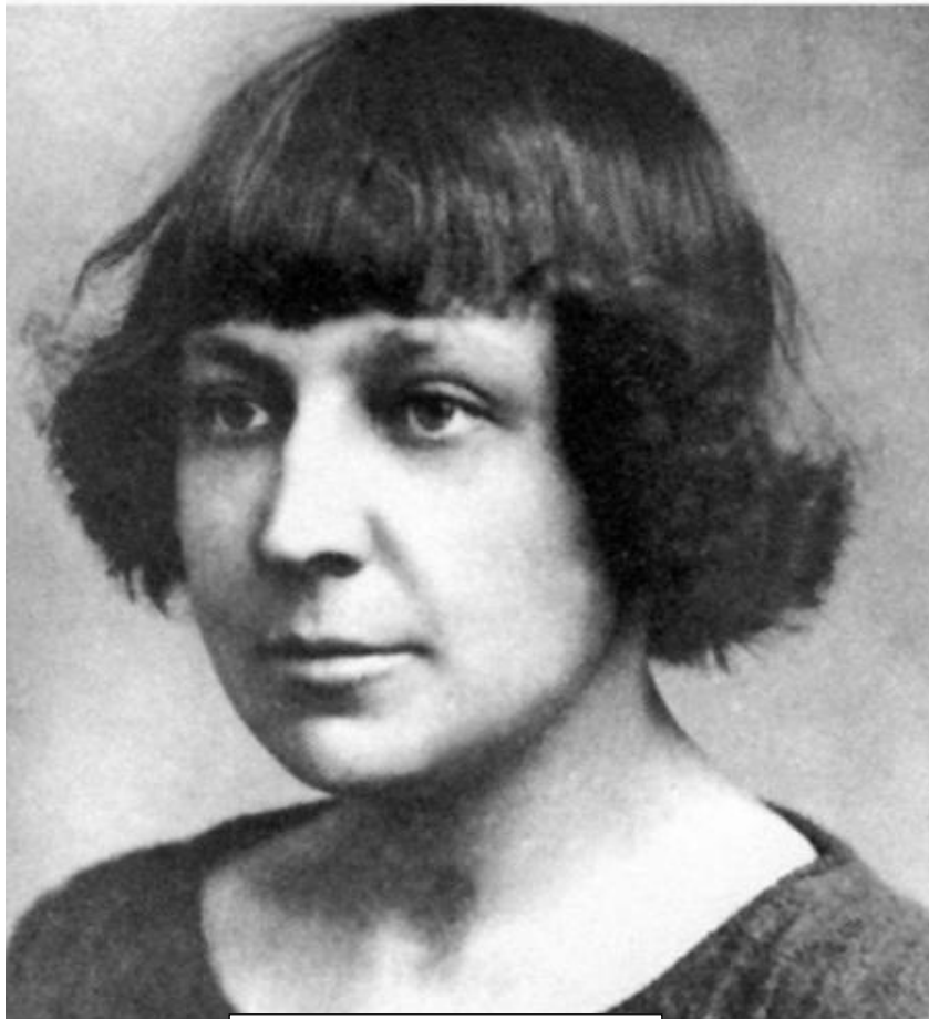
Марина Ивановна Цветаева

А в начале 1911 года в этом доме состоялась удивительная встреча трёх поэтов, тогда только что выпустивших свои первые сборники: Максимилиана Волошина, Марины Цветаевой и Аделаиды Герцык. Максимилиан привел 18-летнюю Марину Цветаеву знакомиться с хозяйкой и поэтессой – Аделаидой Казимировной Герцык-Жуковской.